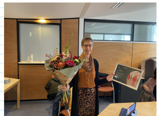
Foto: huldiging 5 jaar lidmaatschap