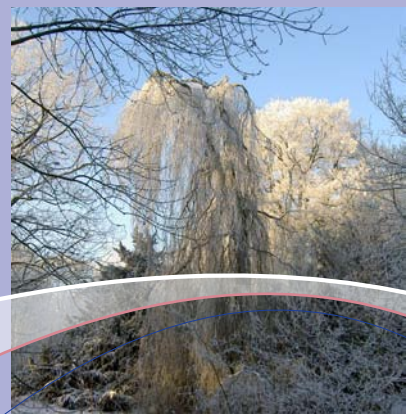
Winter op Coudewater.

Wees zuinig op de natuur en respecteer al het mooie dat er te zien is. Loop een paar meter verder en parkeer je auto niet op het gras dat nu zeker erg veel te lijden heeft. Pak niet de binnenbochten en laten we er vooral met zijn allen voor zorgen dat volgende generaties van bewoners, personeel en bezoekers er hier op dit prachtige landgoed nog lang van kunnen genieten.