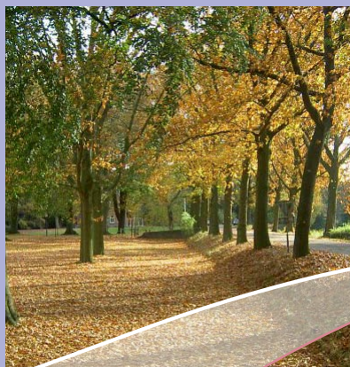
Herfst op Coudewater.