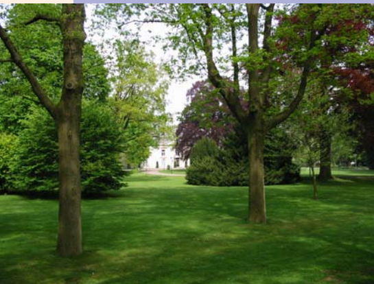
Zomer op Coudewater.

In 1870 begint de geschiedenis van het psychiatrisch ziekenhuis. We lezen slechts één keer in de aantekeningen van oprichter Dr. Pompe dat er geld is besteed aan de verfraaiing van het landgoed. In 1878 wordt er fl. 1000 tot fl. 1500 uitgetrokken voor een beeld en een fontein op het voorterrein. Er wordt dus geen geld uitgetrokken voor de uitbreiding van de flora. Toch wordt een aantal bomen en struiken geschat op een leeftijd tussen de 100 en 200 jaar. Hieronder vindt u een opsomming van enkele markante bomen en struiken.