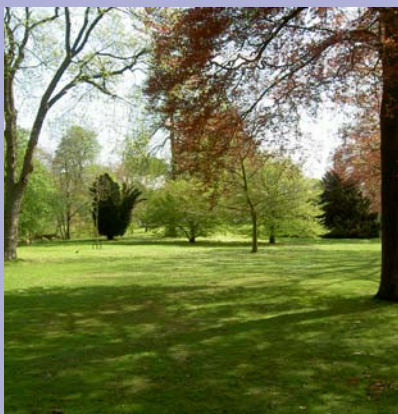
Lente op Coudewater.

De bomen zijn 50 jaar oud. Tenslotte hebben we nog die prachtige lindelaan die tussen de gebouwen 'Willibrorda' en 'Sonnevanck' naar achteren loopt. Het is een zeer sfeervol en donker laantje wat juist in deze warme periode een bezoek meer dan waard is. Het is er vaak heerlijk koel.