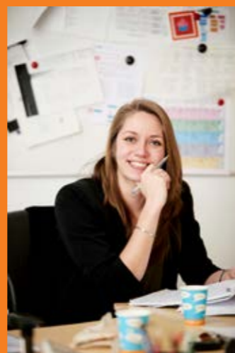
Deze nieuwsbrief is een uitgave van GGZ Oost Brabant. Oplage: 700 ex. Tekst & beeld: Communicatie

Benieuwd naar de werkdag van Esmay? www.ggzooostbrabant.nl/link