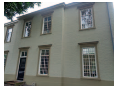
▲ De buitenschil van het gebouw staat er weer piekfijn bij.